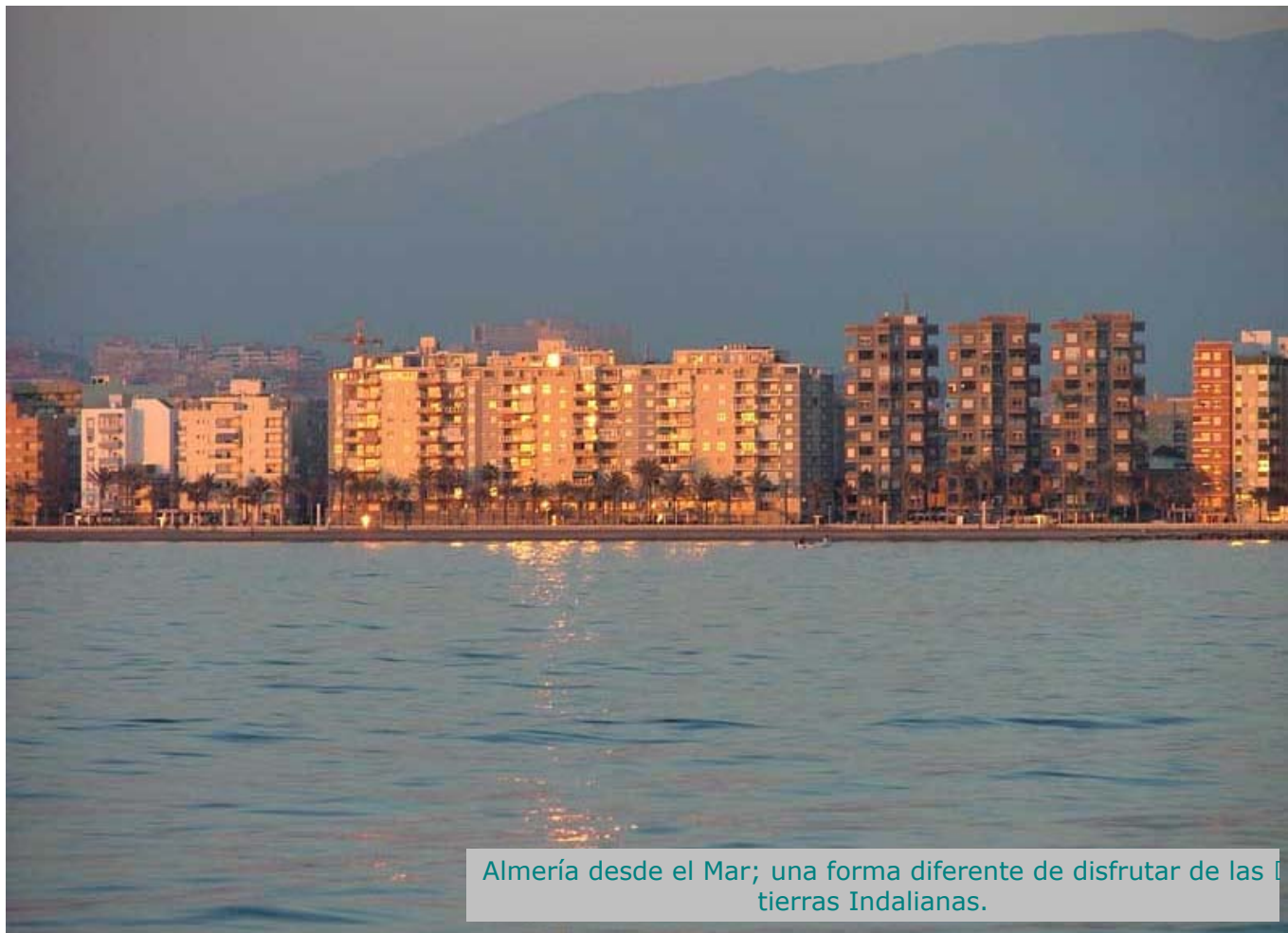
Almería desde el Mar; una forma diferente de disfrutar de las tierras Indalianas.

Reza el refranero popular que .... "Marzo ventoso y Abril lluvioso hacen a Mayo florido y hermoso". Este mes de Marzo los vientos no han sido muy abundantes, pero sí lo suficientemente hermosos como nos refleja esta imagen del Cabo de Gata.