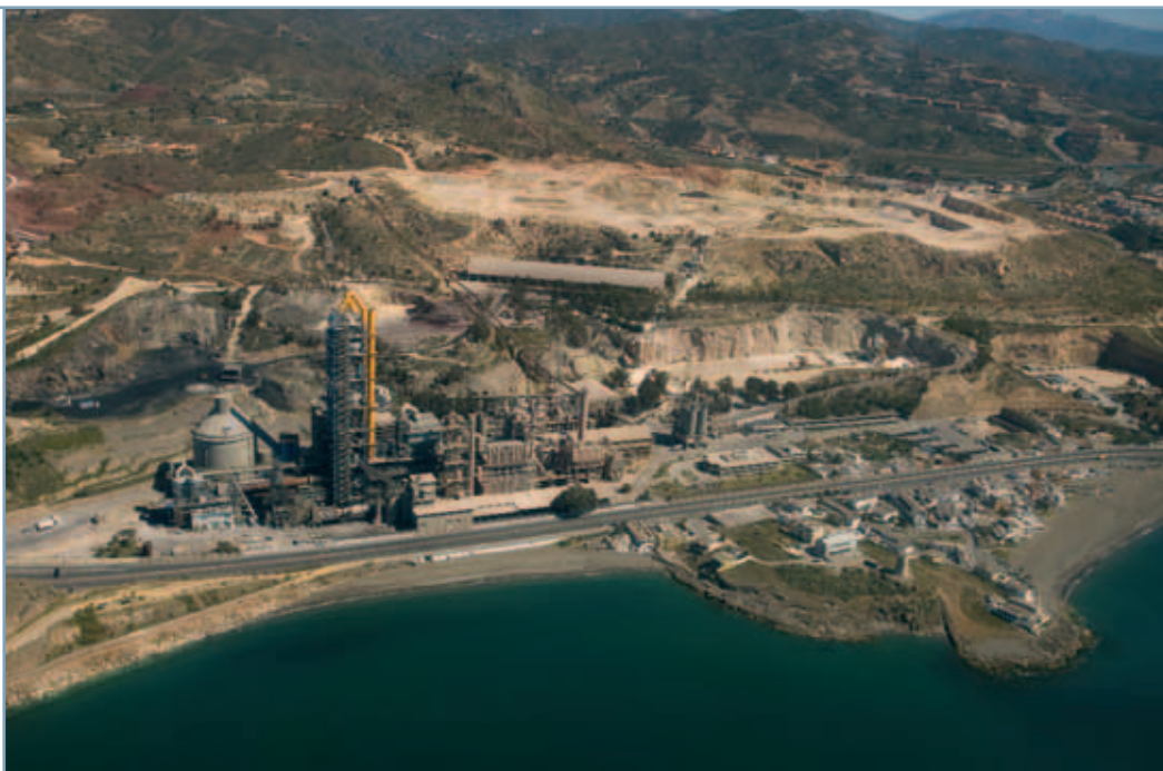
La cementera Goliat contamina la playa de La Araña en Rincón de la Victoria (Málaga)